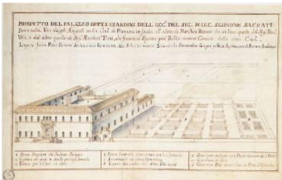
Prospetto del palazzo, orti e giardini di Scipione Sacrati, disegno seicentesco